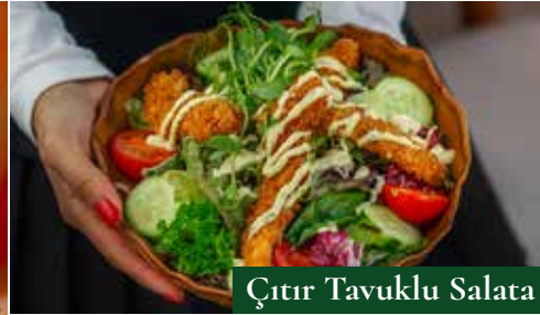
Çıtır Tavuklu Salata