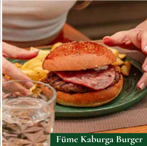
Füme Kaburga Burger