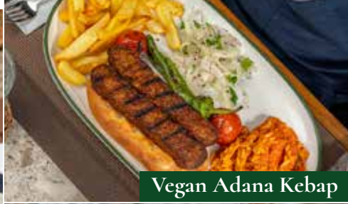
Vegan Adana Kebap