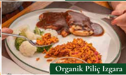
Organik Piliç Izgara