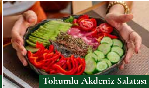
Tohumlu Akdeniz Salatası