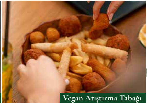
Vegan Atıştırmalık Tabağı