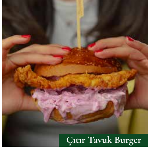
Çıtır Tavuk Burger