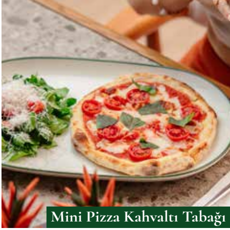
Mini Pizza Kahvaltı Tabagı