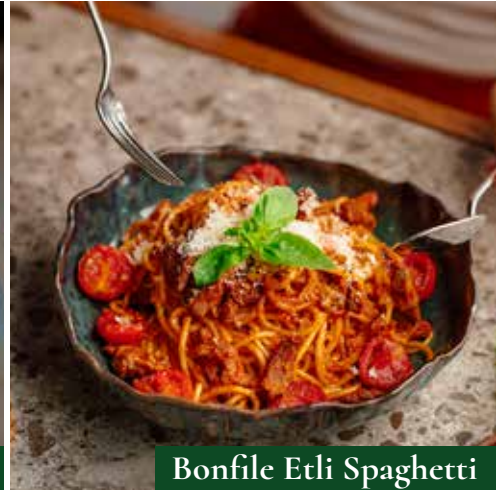
Bonfile Etli Spaghetti