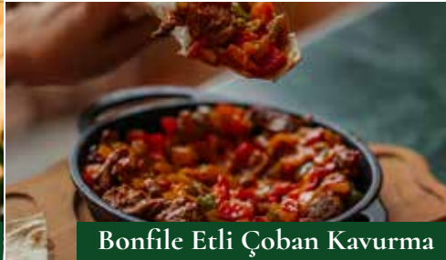
Bonfile Etli Çoban Kavurma