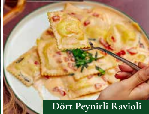
Dört Peyirli Ravioli