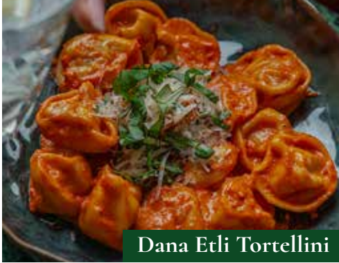
Dana Etli Tortellini