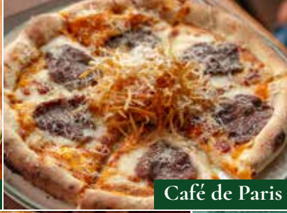
Café de Paris