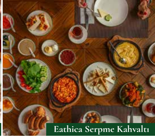
Eathica Serpme Kahvaltı