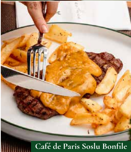
Café de Paris Soslu Bonfile